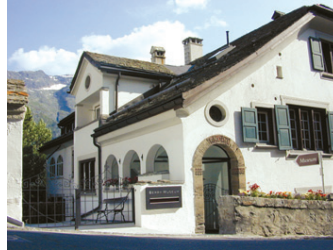
Villa Arona, St. Moritz